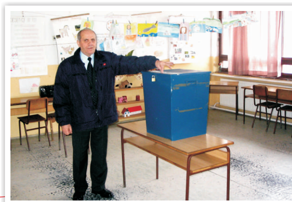
Roditelji biraju direktore škola u Tuzlanskom kantonu